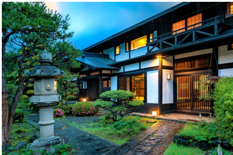
1819年建造 母屋（文化庁登録有形文化財）

世界各国のデザイナーに注目される宿泊施設となった岳麓翠苑は、1日1組限定の一棟貸し宿泊施設として2023年9月30日に開業いたします。