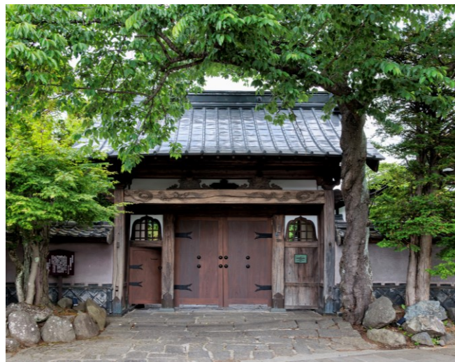
1818年移築 長屋門（富士河口湖町指定有形文化財）